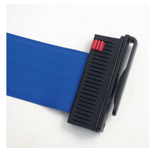
Attacco per cintura