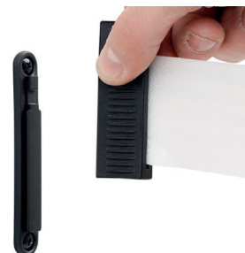
Attacco a muro