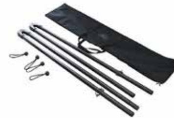
Sacca per il trasporto