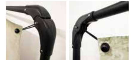
Struttura pieghevole e trasportabile

Supporto per striscioni di grande formato pieghevole in alluminio per esterni. Possibilità di interrimento o applicazione delle seguenti basi: quadrata, a croce, zavorrabile, picchetto e picchetto per neve, ciambella zavorrabile. Telo e stampa non compreso. Sacca per il trasporto inclusa.